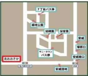
サニータウン・安威方面