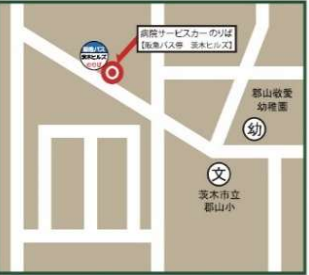
井口台・茨木ヒルズ