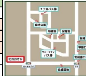
井口台・茨木ヒルズ