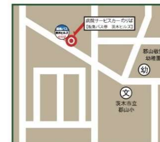
井口台・茨木ヒルズ