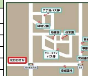
サニータウン・安威方面