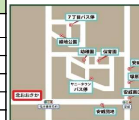
サニータウン・安威方面