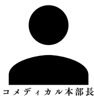
コメディカル本部長

当院は急性期～慢性期、緩和ケアを含む500床からなるケアミックス病院であり、幅広い受け皿として地域医療に貢献しております。このため当院では、探求心に富み、誠実で患者様に寄り添うことのできる薬剤師を募集しています。また、当院は大阪府薬剤師会教育研修認定機関・薬学生教育研修指定機関として積極的に実習生を受け入れる等、新卒の育成にも取り組んでいます。教育につきましては本紙裏面をご覧ください。見学でお会いできることを楽しみにお待ちしております。