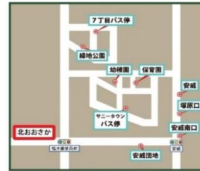
サニータウン・安威方面