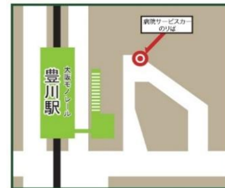
大阪モノレール 豊川駅